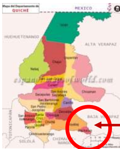
Figura 2. Mapa Municipios de Quiche

LOCALIZACIÓN MUNICIPIO DE PACHALUM, QUICHE