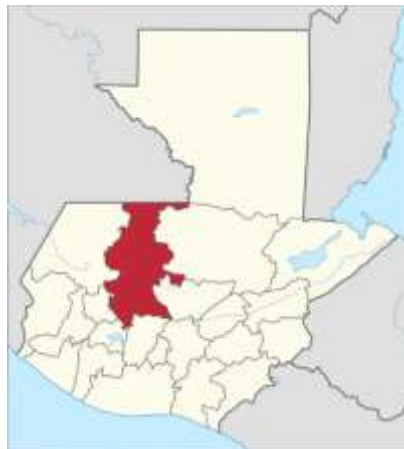
Figura 1. Mapa Departamento de Quiche

Extensión territorial: Cuenta con una extensión territorial de 100 kilómetros cuadrados.