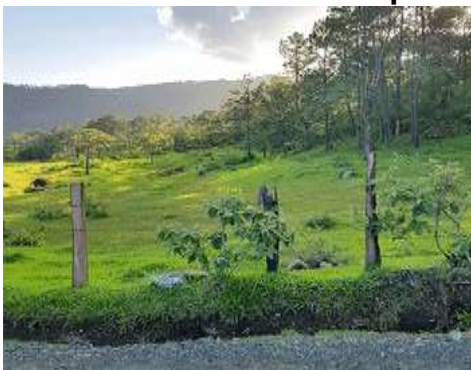
FIGURA 7. bosque

“Los bosques naturales del área no reciben ningún tipo de manejo, únicamente son intervenidos para extracciones de leña y madera en forma selectiva. Así mismo la especie de Pinus oocarpa .