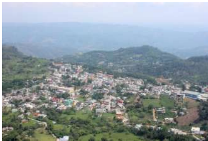
Figura 3. VISTA PANORÁMICA PACHALUM, QUICHE