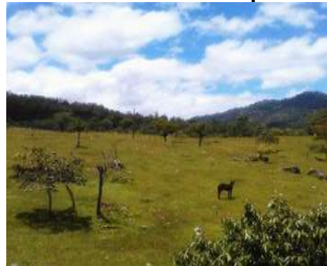
FIGURA 8. bosque