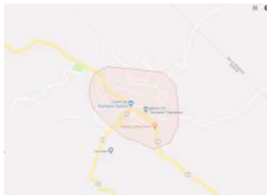
FIGURA 6. DIVISIÓN POLÍTICA

El municipio de Pachalum en el año 1986, era aldea del municipio de Joyabaj, fue entonces cuando un comité específico y vecinos de la aldea Pachalum se organizaron para realizar los trámites correspondientes para que dicho poblado fuera elevado a la categoría de Municipio, con el propósito de tener un mejor desarrollo en el ámbito social y económico. Según lo regulado por el Código Municipal Decreto 12-2002 el expediente de la Aldea llenaba todos los requisitos mínimos para elevar de categoría al lugar.