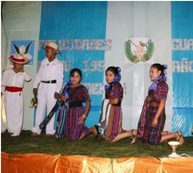
FIGURA 4. FIESTA PATRONAL