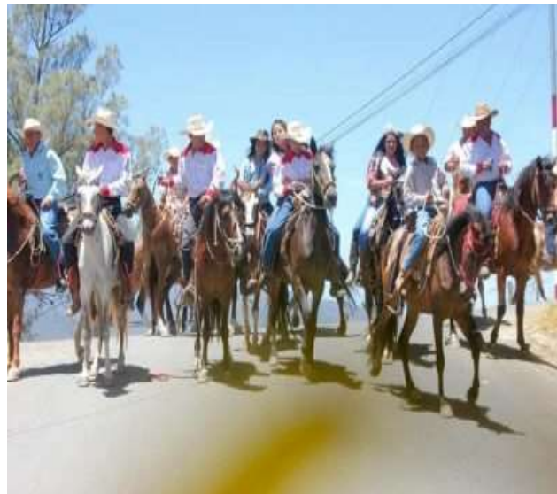
FIGURA 5. PACHALUM Y SU GENTE