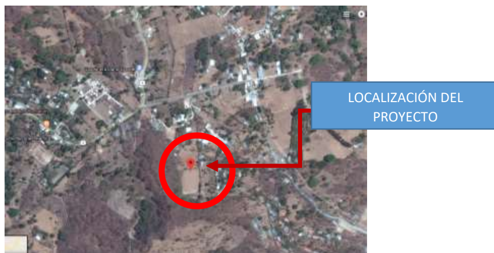
FIGURA 9. Localización del proyecto

El proyecto se encuentra ubicado en la Aldea Las Veguitas, Municipio de Pachalum, Quiche, en las coordenadas 14°55'02.6"N 90°40'45.4"O