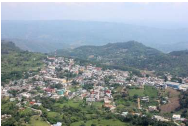
Figura 3. VISTA PANORÁMICA PACHALUM, QUICHE