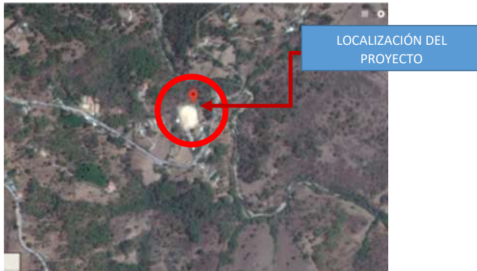
FIGURA 9. Localización del proyecto

El proyecto se encuentra ubicado en la Caserío Piedras Blancas, Municipio de Pachalum, Quiche, en las coordenadas 14°55'30" N, 90°38'7" O, 1210 MSNM