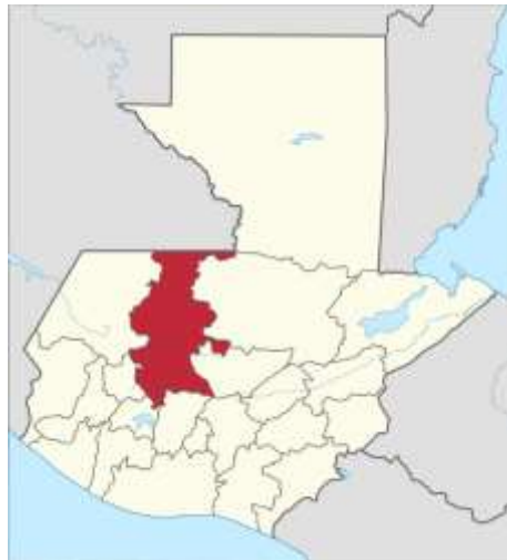
Figura 1. Mapa Departamento de Quiche

Extensión territorial: Cuenta con una extensión territorial de 100 kilómetros cuadrados.