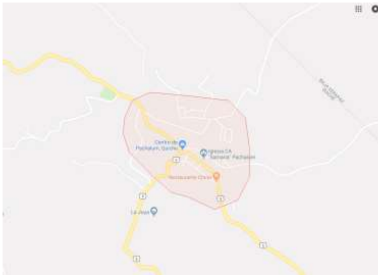
FIGURA 6. DIVISIÓN POLÍTICA

El municipio de Pachalum en el año 1986, era aldea del municipio de Joyabaj, fue entonces cuando un comité específico y vecinos de la aldea Pachalum se organizaron para realizar los trámites correspondientes para que dicho poblado fuera elevado a la categoría de Municipio, con el propósito de tener un mejor desarrollo en el ámbito social y económico. Según lo regulado por el Código Municipal Decreto 12-2002 el expediente de la Aldea llenaba todos los requisitos mínimos para elevar de categoría al lugar.