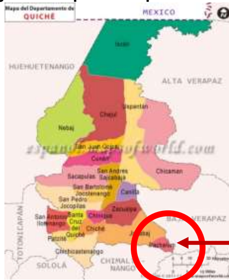
Figura 2. Mapa Municipios de Quiche